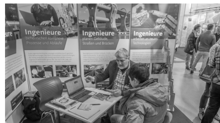
Mehr als 33.000 Besucher kamen auf die Karrierestart 2017. Natürlich interessierten sich viele Schüler auch für den Ingenieurberuf und ließen sich hierzu beraten.

„Was macht eigentlich ein Ingenieur?“ – Das war vermutlich die am häufigsten gestellte Frage, der sich die Standbetreuer der Ingenieurkammer Sachsen und des VDI auf der diesjährigen Karrierestart stellen mussten. Dabei zeigte sich, dass das Interesse junger Menschen am Ingenieurberuf zwar nach wie vor stark vorhanden ist. Jedoch mangelt es den meisten Schülern – verständlicherweise – an konkreten Vorstellungen. Ziel unseres Ingenieurstandes war es, diese Lücke zu schließen und einen Einblick in die Voraussetzungen und in den Werdegang eines Ingenieurs zu geben. Hierfür bot die Karrierestart 2017 das perfekte Umfeld. Mit 500 Ausstellern und mehr als 33.000 Besuchern konnte die Messe Rekordzahlen vermelden. Diese Resonanz schlug sich auch am Stand der Ingenieurkammer und des VDI nieder, so dass die anwesenden Betreuer sich nahezu durchgehend in Beratungsgesprächen befanden.