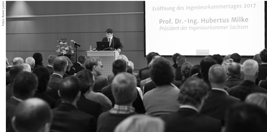
Eröffnung des Ingenieurkammertages 2017

Offizielle Kammer-Nachrichten und Informationen