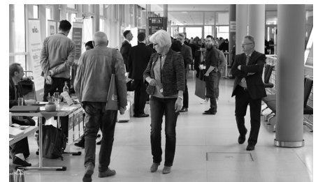
Die Pausen nutzten viele Teilnehmer zum Besuch der umfangreichen Foyer-Ausstellung.