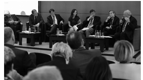
Im Fokus der moderierten Podiumsdiskussion stand die Frage nach dem Sinn und Unsinn von Zertifizierungen.