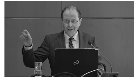
Der sächsische Innenminister Markus Ulbig betonte die stets gute Zusammenarbeit mit der Ingenieurkammer und stellte weitere Gespräche zur qualitativen Sicherung von Ingenieurleistungen in Aussicht.