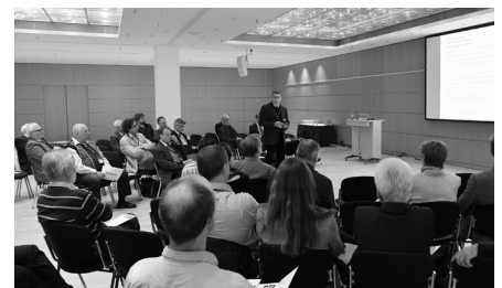
In den Fachsektionen (hier der Workshop Wärmewende) gab es interessante Vorträge und angeregte Diskussionen.