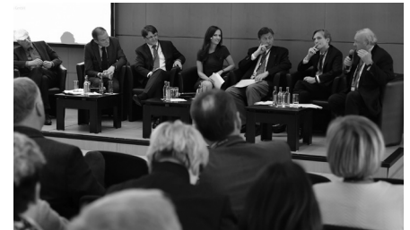
Im Fokus der moderierten Podiumsdiskussion stand die Frage nach dem Sinn und Unsinn von Zertifizierungen.