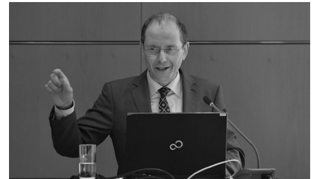
Der sächsische Innenminister Markus Ulbig betonte die stets gute Zusammenarbeit mit der Ingenieurkammer und stellte weitere Gespräche zur qualitativen Sicherung von Ingenieurleistungen in Aussicht.