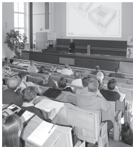
Hohes Interesse bei Planungsbüros: Rund 100 Teilnehmer fanden sich zum BIM-Workshop an der HTW Dresden ein.

Rund 100 Teilnehmer informierten sich am 5. September beim ersten gemeinsamen BIM-Workshop der Architektenkammer Sachsen, der Ingenieurkammer Sachsen, der HTW Dresden und der CADsys Vertriebs- und Entwicklungsgesellschaft mbH zur Anwendung von Building Information Modeling im Planungsbüro. Neben den Grundlagen deckten die Fachvorträge auch Themen wie BIM-Einführung im Unternehmen, Fördermöglichkeiten, Software-Lösungen, rechtliche Rahmenbedingungen und erste praktische Erfahrungen ab. Von den Teilnehmern selbst konnten zehn Prozent auf Praxiserfahrungen mit der BIM-Methode verweisen. Dies zeigte einmal mehr den hohen Weiterbildungsbedarf in Bezug auf Building Information Modeling.